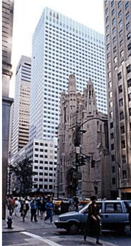
Edificio Tishman: Quinta Avenida 666, New York, NY (USA).

El 666, número de la bestia en Apocalipsis 13,18, ya aparece en el Antiguo Testamento: I Reyes 10,14 dice que es el número de talentos de oro que recibía Salomón en un año, y Esdras 2,13 dice que es el número de hijos de Adoniyam, nombre que significa “señor de los enemigos”.